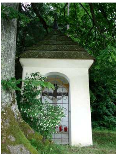
Slika 7: Urbančeva kapelica