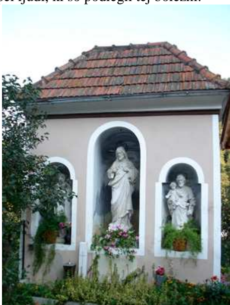
Slika 34: Znamenje v Žvikartovem (Krajcirtovem) vrtu

Znamenje stoji na Ruti ob železniški progi. Izvor znamenja ni znan.