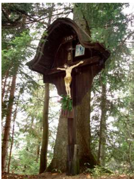
Slika 23: Pšajderov križ