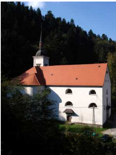
Slika 27: Devica Marija v Puščavi