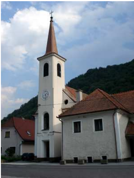
Slika 42: Sv. Ožbalt

Cerkev je bila zgrajena 1813 leta na mestu, kjer je prej stala prejšnja cerkev. Prva božja služba se je v novi cerkvi zgodila prav na ožbaltško nedeljo, 8.8.1813. Cerkev so počasi obnavljali in kupovali vse potrebno za dostojno bogoslužje.