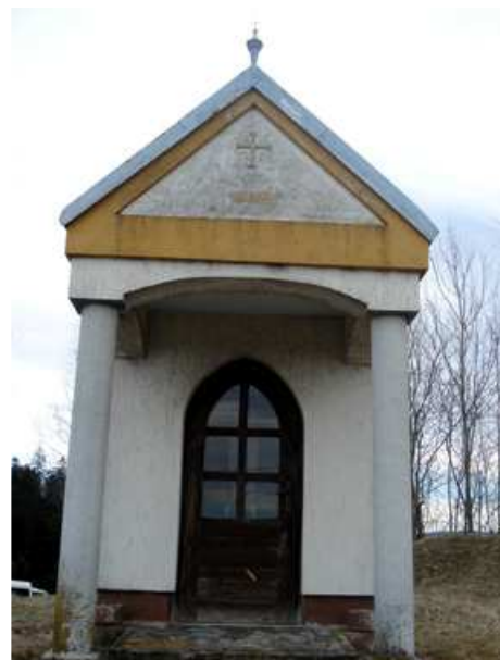
Slika 62: Šrongerjeva kapela na Zg. Kapli