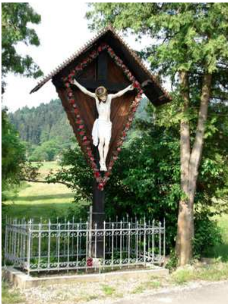
Slika 19: Kašnerjev križ

Stoji ob cesti pod kmetijo Kavčič. Do leta 1962 je bil pri križu velikonočni blagoslov.