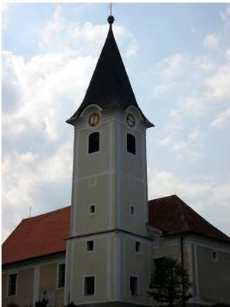
Slika 50: Cerkev sv. Katarine

Zgrajena je bila takoj po letu 1813, ko je zgorela kapela, ki je prej stala na tem mestu. Material za gradnjo so dobivali kar iz bližine, kjer je danes pokopališče.