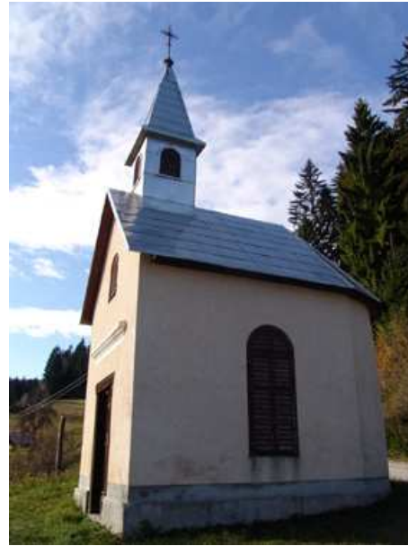
Slika 31: Lamprehtova kapela