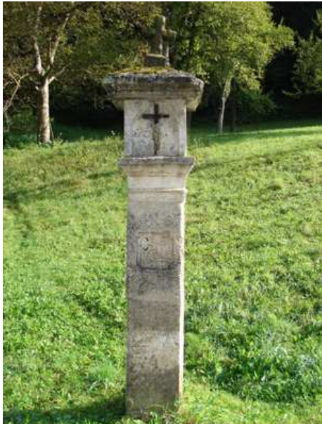
Slika 37: kužno znamenje pri Črešniku