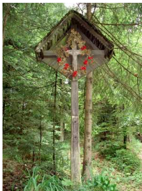
Slika 22: Povhov križ