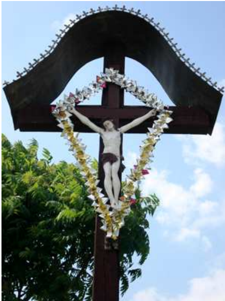
Slika 68: Ležančev križ na Sp. Kapli