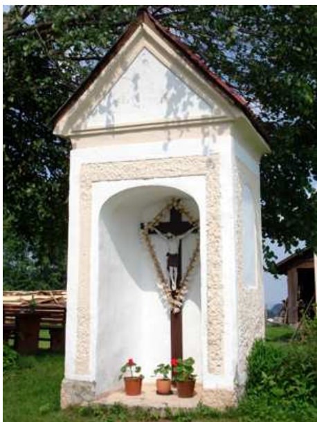
Slika 57: Krajcirtova kapela na Sp. Kapli

Kapelo pri Krajcirtu na Sp. Kapli so postavili v letu 1897. To je zapisano na križu, ki je pritrjen v notranjosti kapele. Na njem piše, da jo je zgradil F. D. Javornigg in je bila posvečena 18. avgusta 1897.