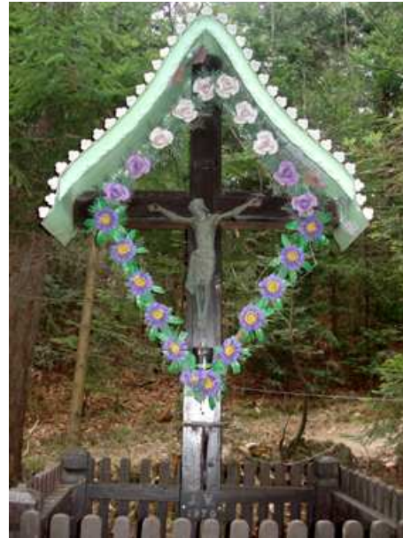
Slika 69: Odanov križ na Sp. Kapli