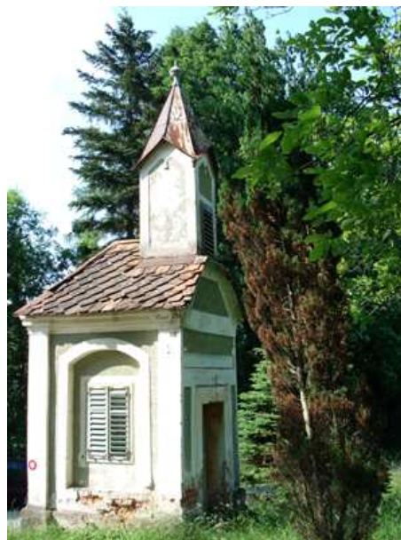
Slika 6: Hojnikova kapelica

Kapelica stoji pri Morijevi domačiji. Kapelico je sezidal Feliks Mori, ko je bil hudo bolan. Zaobljubil se je, da bo postavil kapelico, če bo ozdravel. Postavljena je bila leta 1944.