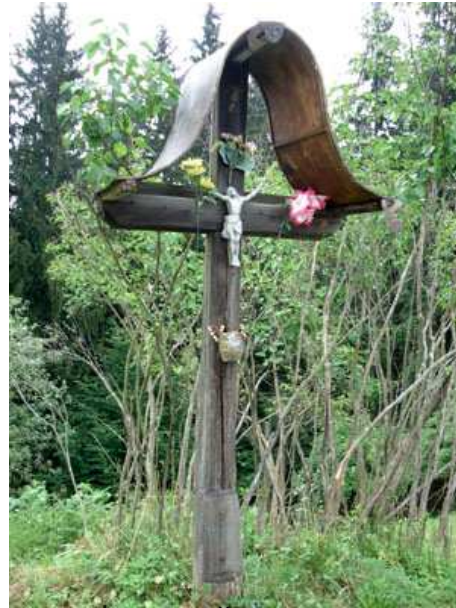
Slika 26: Žumrov križ

Križ stoji na mestu, kjer se je smrtno ponesrečil eden iz družine Sinrajh.