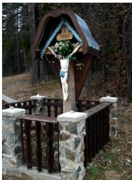
Slika 48: Ulbinov križ na Ulbinovem vrhu

Stoji na križišču poti, ki pelje na Duh. Kdaj je bil postavljen, se ne ve. Najverjetneje pa je bil postavljen zaradi križišča in lažje orientacije mimoidočih.