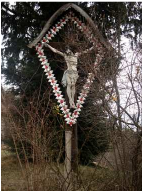
Slika 66: Kočunkov (Spodnji) križ na Sp. Kapli

Ta križ je edini križ, o katerem je spletena zgodba o hlapcu, ki ni hotel moliti in ga je požrl vrag. Pustil je samo njegove škornje in krvavo skalo.