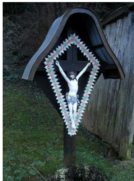
Slika 73: Žajdlov križ na Sp. Kapli

Postavili so ga zaradi spomina na uboj nekega domačina.