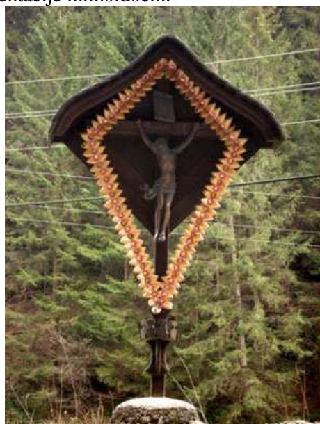
Slika 49: Vauherjev križ ob Čermenici

Križ je postavljen na nekoliko večji skali, saj naj bi ta skala pokopala pod seboj na sam poročni dan ženina in nevesto, ko sta odhajala k poroki. Skala je poškodovala tudi nekaj svatov. V spomin na žalosten dogodek so na skalo postavili križ. Kdaj je to bilo, ni znano.