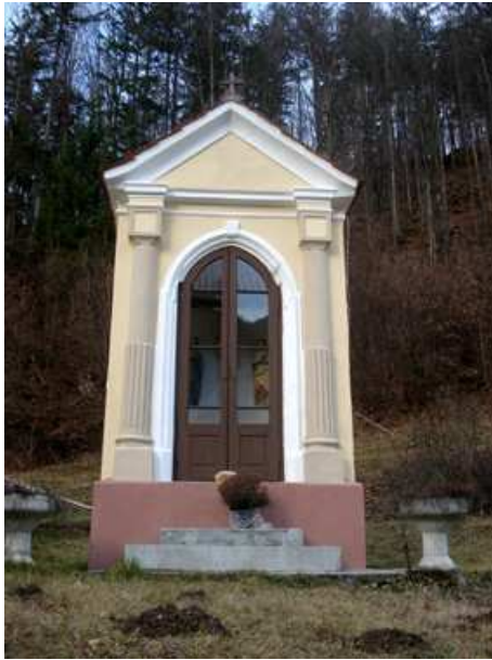
Slika 59: Preklova kapela na Sp. Kapli

Kapela je bila postavljena avgusta 1913. Na istem mestu je prej stal križ, ki je bil nekdanj na kapelskem pokopališču. Kapelo je blagoslovil Maks Vraber, kasnejši stolni prošt v Mariboru.