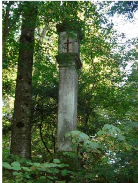
Slika 36: Kužno znamenje na Jodlu