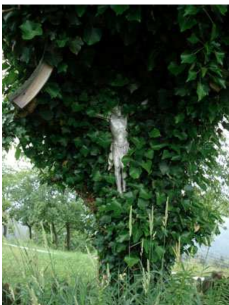
Slika 21: Pečovnikov križ