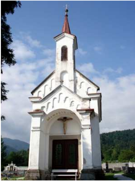
Slika 9: Pokopališka kapela

Kapelo je dala postaviti vdova Katarina Karlatec leta 1866.