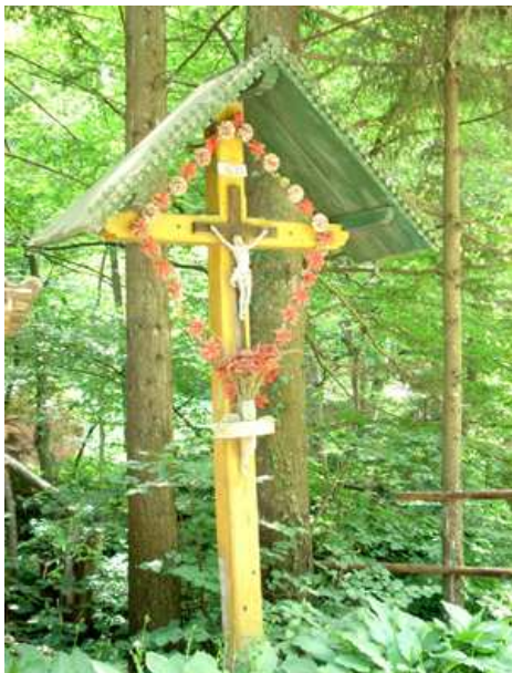
Slika 13: Ahejev ali Strgarjev križ