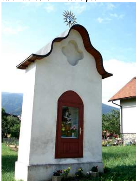
Slika 12: Znamenje pri Mauriču

Znamenje je tristrano s tremi polkrožnimi nišami. Zamenje je iz 19. stoletja. Po pripovedovanju je v vsej dolini razsajala kuga in pomrli naj bi vsi ljudje. Le Fakov gospodar je ozdravel in dal iz hvaležnosti postaviti to znamenje.