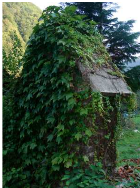
Slika 33: Znamenje pri Hitlu

Imenujejo ga tudi Požunovo znamenje. Postavljeno je na Gomili. Njegov slog ni značilen za te kraje. Znamenje je bilo postavljeno leta 1669 v spomin na kugo. Po izročilu naj bi stalo na grobovih številnih trupel ljudi, ki so podlegli tej bolezni.