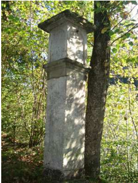
Slika 35: Kužno znamenje na Oslici ali pri sv. Ani