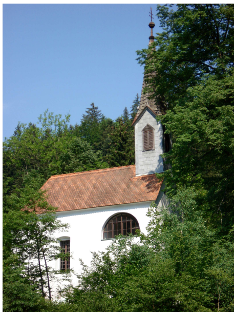
Slika 28: Kapela sv. Ane na gričku Oslice