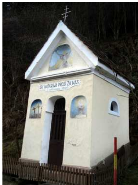
Slika 56: Kovačeva kapela na Sp. Kapli