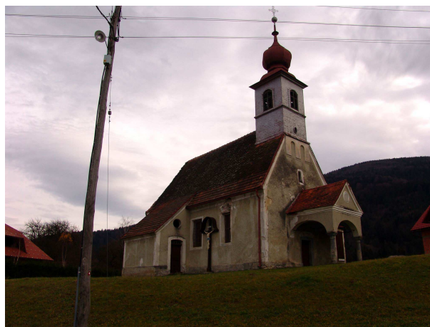
Slika 4: Cerkev sv. Radegunde

Sedanja stavba je iz okoli leta 1756, omenjala pa se je že leta 1184. Stavba je skoraj v celoti enovite baročne gradnje.