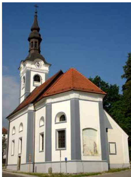
Slika 2: Cerkev sv. Križa

Na tem mestu je prej stala lesena kapela, katero pa je leta 1759 nadomestila sedanja romarska cerkev.