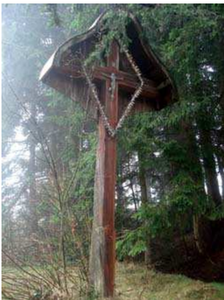
Slika 72: Švarankov (Zgornji) križ na Zg. Kapli