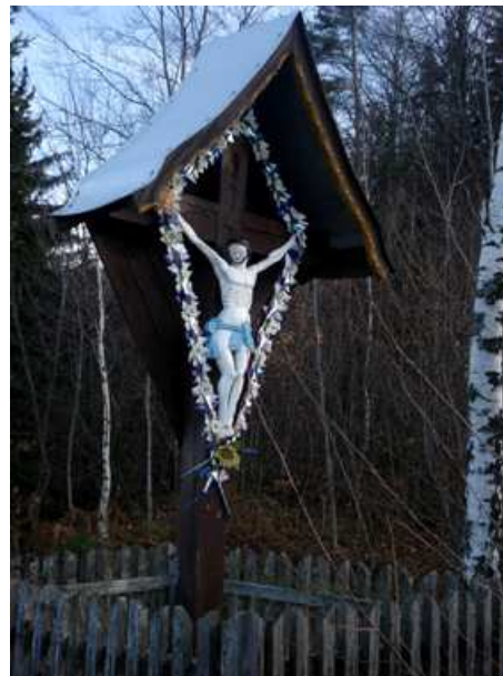
Slika 67: Lampredov križ v Gradišču

Ta križ je edini križ, o katerem je spletena zgodba o hlapcu, ki ni hotel moliti in ga je požrl vrag. Pustil je samo njegove škornje in krvavo skalo.