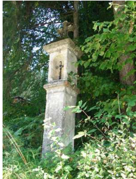
Slika 38: Kužno znamenje pri Puščavskem pokopališču