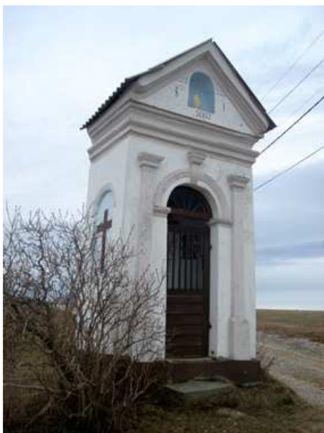
Slika 51: Breznikova kapela na Sp. Kapli