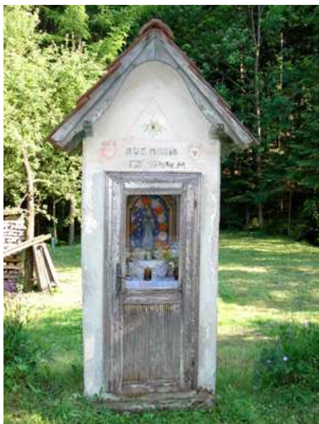
Slika 5: Morijeva ali Paradižova kapelica

Kapelica stoji pri Morijevi domačiji. Kapelico je sezidal Feliks Mori, ko je bil hudo bolan. Zaobljubil se je, da bo postavil kapelico, če bo ozdravel. Postavljena je bila leta 1944.