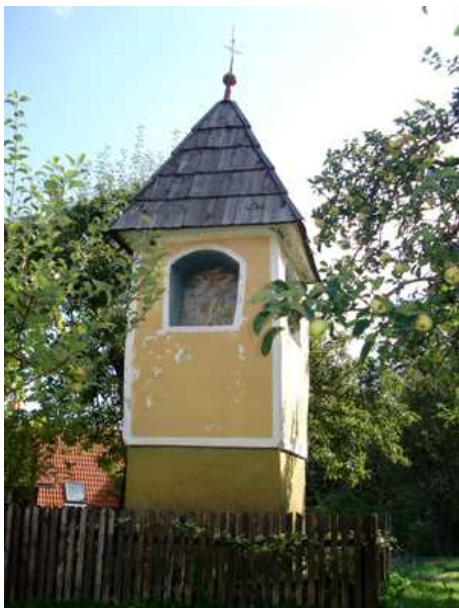
slika 32: Štučevo znamenje na Činžatu