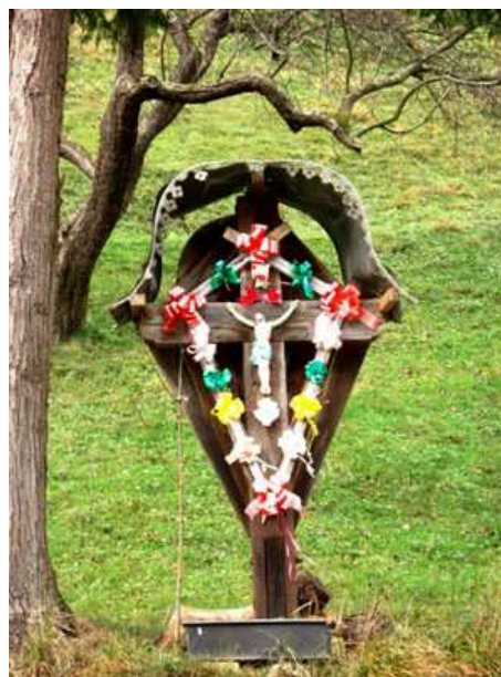
Slika 44: Lenčev križ ob Čermenici