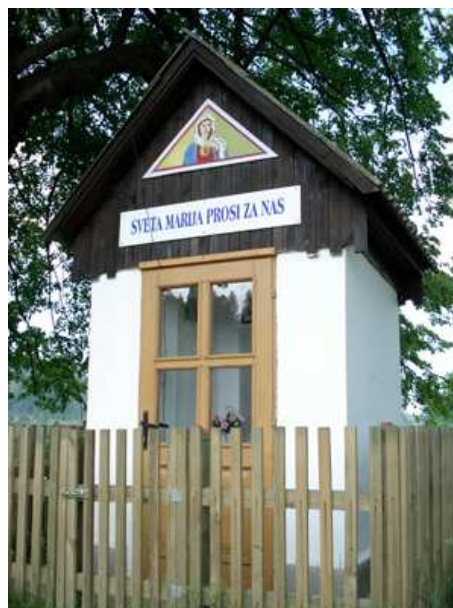
Slika 52: Čevnikova kapela na Zg. Kapli