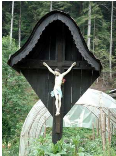
Slika 16: Helblöv križ

Križ označuje razcep ceste. Postavljen je bil v prejšnjem stoletju. V času po zadnji vojni so imeli pri tem križu velikonočni blagoslov.