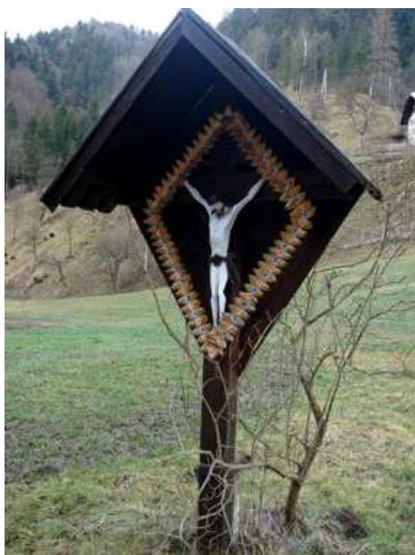
Slika 47: Ropov križ ob Čermenici

Stoji na križišču poti, ki pelje na Duh. Kdaj je bil postavljen, se ne ve. Najverjetneje pa je bil postavljen zaradi križišča in lažje orientacije mimoidočih.