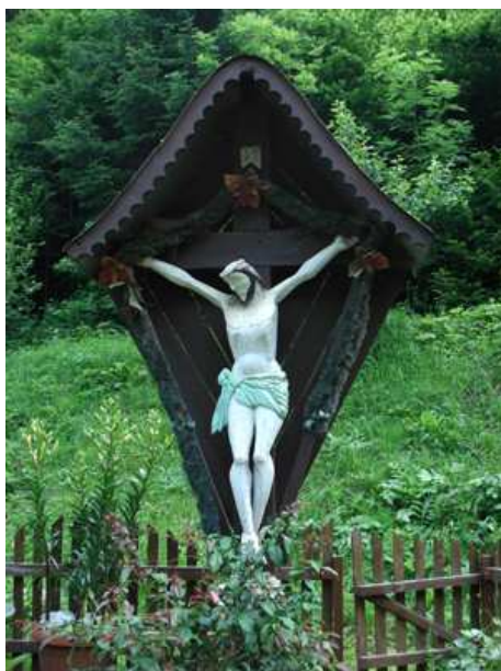
Slika 43: Kojzekovega mlinarja križ