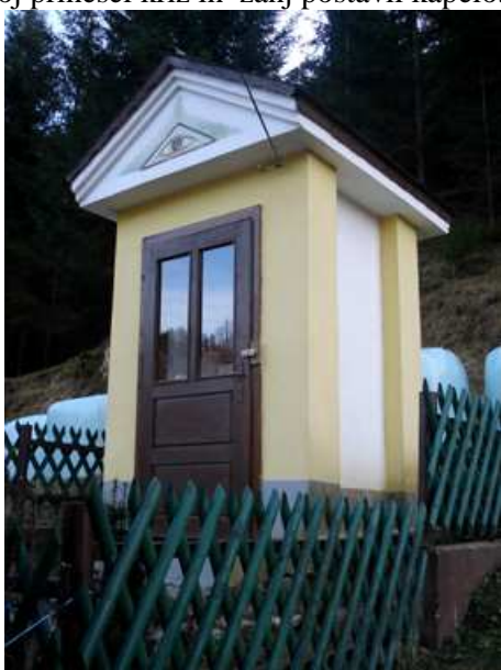
Slika 53: Grabnfomerjeva kapela na Sp. Kapli