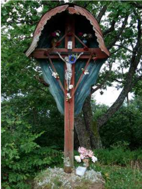
Slika 17: Hudejev križ