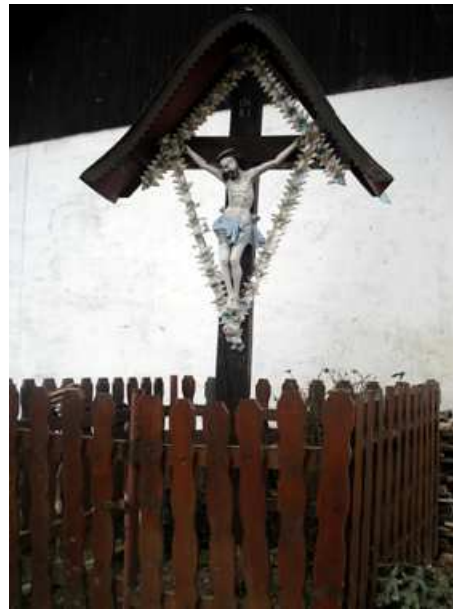
Slika 65: Huberjev križ na Sp. Kapli