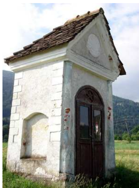
Slika 8: Kapelica na Glažučkem polju pod trgom

Stoji nad kmetijo Urbanc. Jakob Urbanc st. jo je dal postaviti leta 1914 kot priprošnjo za srečno vrnitev sinov iz prve svetovne vojne.