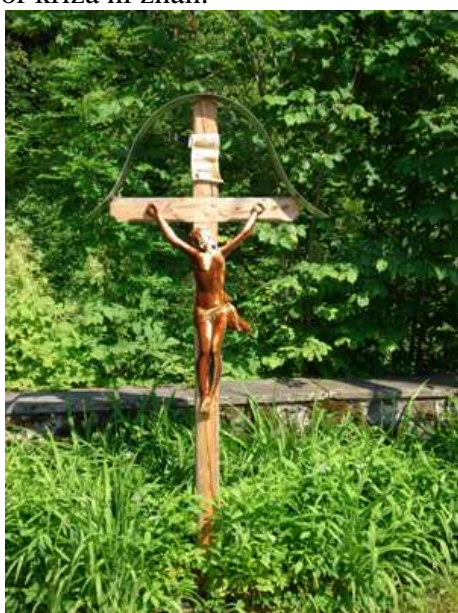
Slika 41: Puščavski križ

Pred tem križem je stal na tem mestu lesen križ z lesnim korpusom, katerega so uničili. Pred nekaj leti so dali postaviti novega z železnim odlitkom.