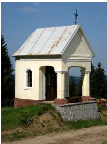
Slika 61: Rihterjeva kapela na Sp. Kapli

Kdaj so postavili kapelo ni znano. Miha Kure, ki je sosed in zanjo skrbi, je povedal, da je bila zgrajena zato, ker je pred približno 150 do 200 leti skoraj vsako leto zapored pridelke na polju uničila toča. Ravno tam je potokla in izničila vse vloženo delo celega leta. Da bi toča prenehala uničevati, so postavili kapelo