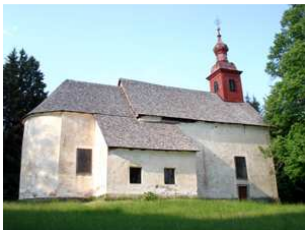
Slika 1: Cerkev sv. Ignacija

Na tem mestu je prej stala lesena kapela, katero pa je leta 1759 nadomestila sedanja romarska cerkev.