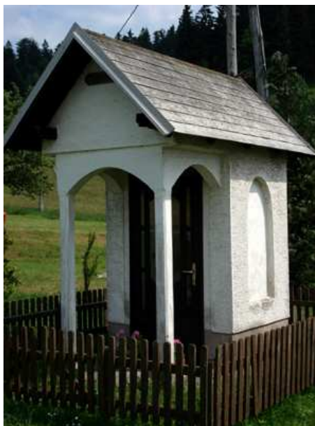
Slika 58: Močivnikova kapela na Zg. Kapli

Kapelo pri Krajcirtu na Sp. Kapli so postavili v letu 1897. To je zapisano na križu, ki je pritrjen v notranjosti kapele. Na njem piše, da jo je zgradil F. D. Javornigg in je bila posvečena 18. avgusta 1897.