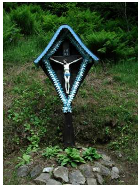
Slika 71: Prajzlov križ na Sp. Kapli

Križ je bil postavljen zaradi tamkajšnjega pokopališča.