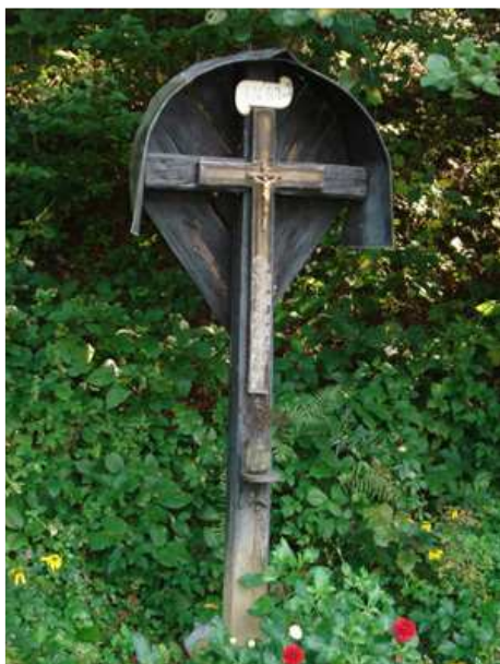
Slika 39: Doverov križ