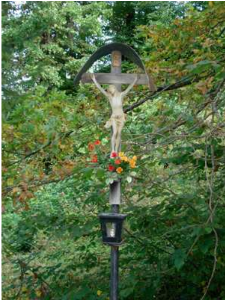
Slika 25: Sinrajhov križ

Križ stoji na mestu, kjer se je smrtno ponesrečil eden iz družine Sinrajh.