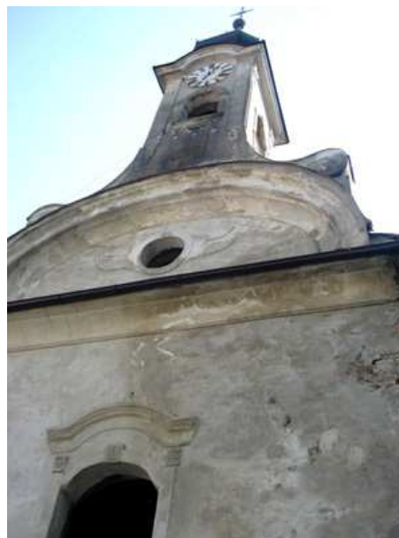
Slika 29: Kapela sv. Nikolaja na Falskem gradu