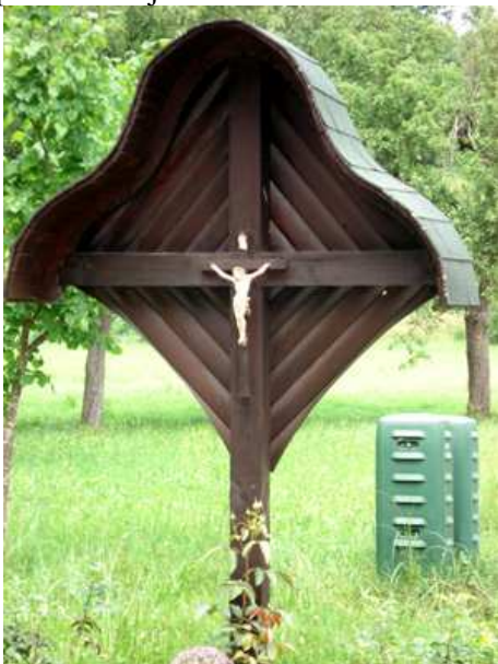
Slika 15: Grobenvirtov križ