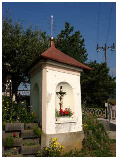
Slika 11: Znamenje pri Faku

Figuralno znamenje so dali postaviti tržani, ki so se v 18. stoletju v velikem številu preživljali s splavarjenjem lesa po Dravi. Flosarji so k znamenju nosili darove v zahvalo za srečno vrnitev s poti.