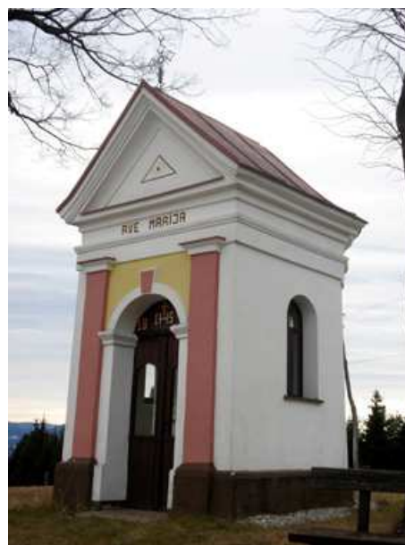
Slika 54: Holcmanova kapela na Sp. Kapli

Kapela pri Grabnfomerju je bila postavljena in blagoslovljena 9. maja 1971, kot spomin na