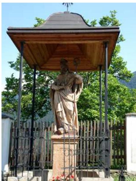
Slika 10: Figuralno znamenje Sv. Miklavža

Figuralno znamenje so dali postaviti tržani, ki so se v 18. stoletju v velikem številu preživljali s splavarjenjem lesa po Dravi. Flosarji so k znamenju nosili darove v zahvalo za srečno vrnitev s poti.