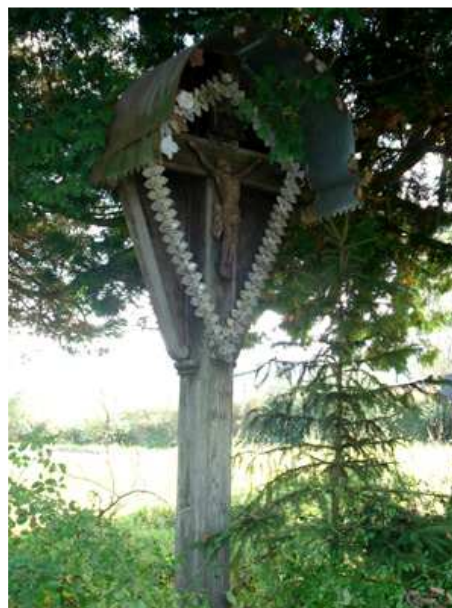
Slika 40: Gozdnikov ali Monetijev križ