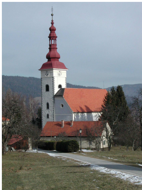
Slika 3: Župnijska cerkev sv. Lovrenca

Prvotna gotška cerkev je nastala pred letom 1381, sedanja zgodnjebaročna pa je iz leta 1659.