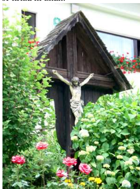
Slika 24: Sgermov križ