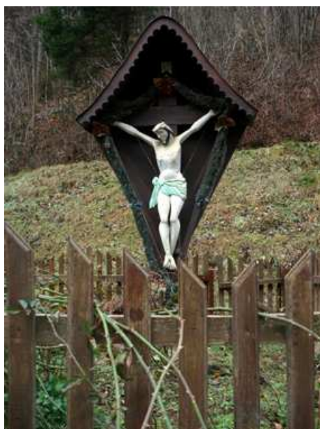
Slika 45: Murkov križ (Kojzekov mlin) v Ožbaltski grabi