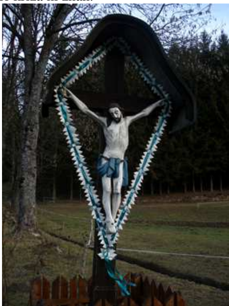
Slika 74: Žlekov križ v Gradišču

Postavili so ga zaradi spomina na uboj nekega domačina.