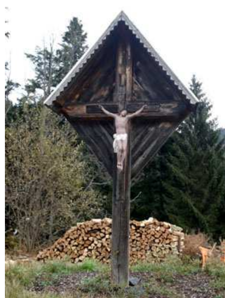
Slika 18: Karlačev križ

Stoji ob cesti pod kmetijo Kavčič. Do leta 1962 je bil pri križu velikonočni blagoslov.