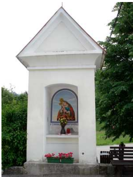
Slika 63: Štrablekova kapela na Zg. Kapli

Kapela je posvečena lurški Mariji leta 1968.