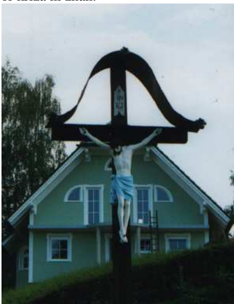
Slika 70: Pokopališki križ

Križ je bil postavljen zaradi tamkajšnjega pokopališča.