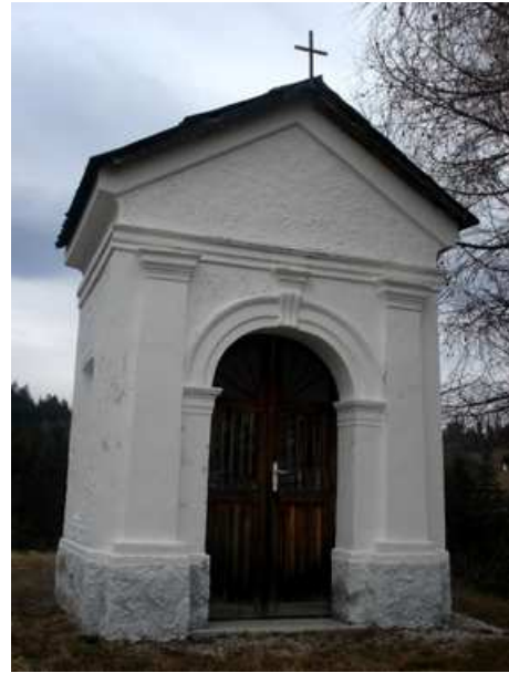
Slika 60: Pušnikova kapela na Zg. Kapli

Kapela je bila postavljena avgusta 1913. Na istem mestu je prej stal križ, ki je bil nekdanj na kapelskem pokopališču. Kapelo je blagoslovil Maks Vraber, kasnejši stolni prošt v Mariboru.