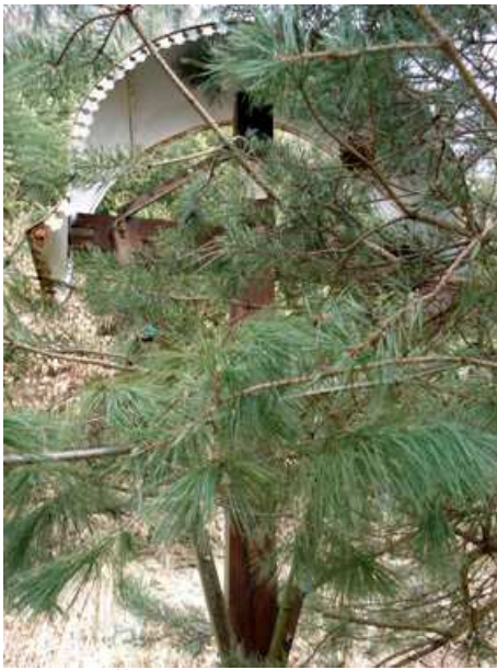
Slika 64: Časmlinarjev križ v Gradišču

Bil je postavljen zaradi zaobljube ob srečni vrnitvi iz prve svetovne vojne. Najprej je stal na mestu, kjer stoji spomenik padlim v drugi svetovni vojni. Ker so ga hoteli povsem odstraniti, so ga Časmlinarjevi postavili blizu svoje hiše.